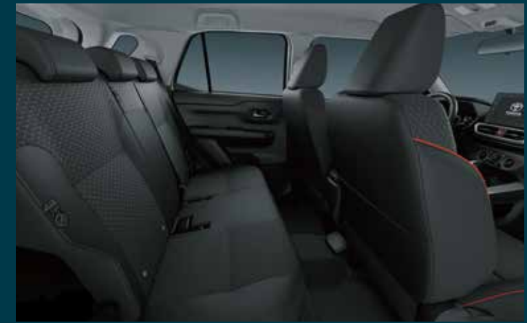
مسافة مريحة بين الراكبَين مقعد خلفي واسع يتصدّر هذه الفئة من السيارات من حيث المسافة بين الراكبَين الجالسَين فيه.

Ample luggage space Class-leading luggage capacity ensures outstanding versatility.